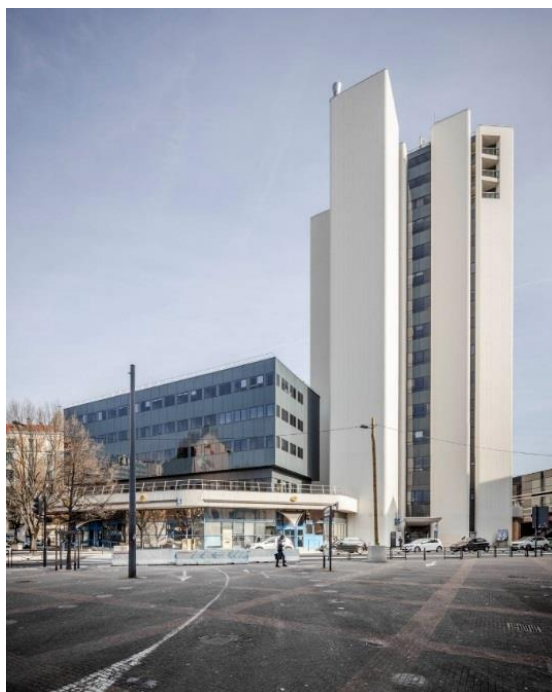
@Florent Michel – 11h45

Ces appels à projets « Les années 70 » ont pour objectif de sélectionner des projets innovants portés et développés par des groupements. Tout en étant en adéquation avec les valeurs du Groupe La Poste et des partenaires associés aux appels à projet, les candidats auront une liberté conceptuelle et opérationnelle pour pouvoir apporter des réponses innovantes en termes constructifs, programmatiques, et de performance énergétique mais aussi dans les usages proposés, qui devront refléter l'ambition de transformation des villes concernées.